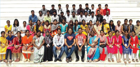
INDUSTRIAL VISIT - INFOSYS

Department of CSE has a huge demand in today's IT & Software world. Keeping this in view, Department is emphasizing more on teaching fundamentals, providing research projects & engaging students in industry internships. Our well qualified & experienced faculty are here to make students excel in their career as top notch professionals