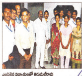
ఎంపైజైన్ విద్యార్థులకు ఉద్యోగాలు

భీమారం, హన్మండ్రే: భీమారంలోని ఎస్.వి.ఎస్ కళాశాల క్యాంపస్ ఇంటర్వ్యూలో విద్యార్థులకు ఉద్యోగ నియామకం చేసారు. ఇందులో కీన్ టెక్నాలజీస్, సీఎస్.ఎస్.ఆర్ కంప్యూటర్ సాఫ్ట్వేర్, ఎంపైజైన్ ఎంపీఎస్ కళాశాలలకు రెండువేల 27 మంది విద్యార్థులు ఎంపికయ్యారు. ఎంపైజైన్ వారికి వేతనంగా రూ.80 లక్షలు చెల్లిస్తారు. ఆరు వందలాది స్టూడెంట్లకు వేతనంగా రూ.100 మంది విద్యార్థులు ఎంపికయ్యారు. ఎంపైజైన్ వారిలో ఎస్.వి.ఎస్ విద్యార్థుల సంఖ్య కె.ఎల్.ఆర్. కేంద్రాలకు చెల్లిస్తారు. కాబట్టి వారిని ఎంపైజైన్ విద్యార్థులకు నియామక పత్రాలను అందించి, అభినందించారు. తమ విద్యార్థులతో ఉద్యోగ నియామకాలకు రోజువారీ కేర్లు తరగతులను విద్యార్థులకు నిర్వహిస్తున్న ఆయన తెలిపారు. కాబట్టి ఎంపైజైన్ కళాశాల గెట్రెట్.ఓ.ఇ.ఎస్. ప్రెస్.పాఠశాల ద్వారా రమ్మ, ప్రెస్. ప్రెస్.పాఠశాలలో, క్లెయిమ్లను అనుసరించి ఉంచుతూ పాట్లు పాట్లు.