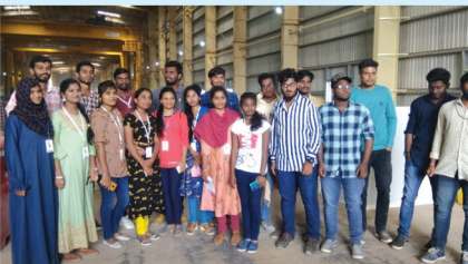
Industrial Visit to kaleshwaram Lift Irrigation Scheme

Civil Engineering is a state of art branch in the field of Engineering that deals with planning, construction and management of fixed structures. Here at SVSIT, Civil engineers learn to design, build, supervise, operate, construct and maintain prestigious projects with an aesthetic sense along with quality work.