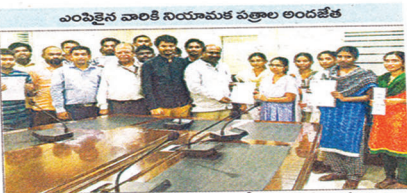
ఎంపైజైన్ వారికి నియామక పత్రాల అందజేత