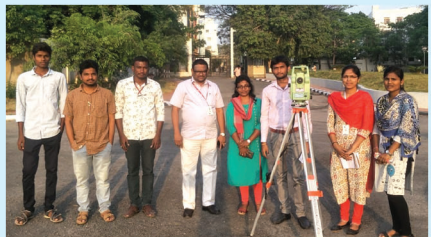
Workshop on Total Station