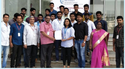
Placement in Sri Sahin Technologies- HYD